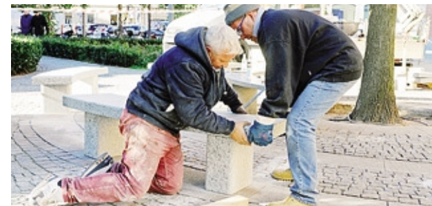
Operai al lavoro sulle panchine in piazza Volta